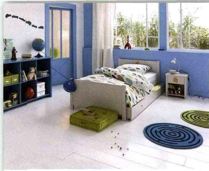
Des tapis rondouillards, une housse de couette expressive et le tout-petit se sent bien. Fly, lit Diabolo, 145 € environ.