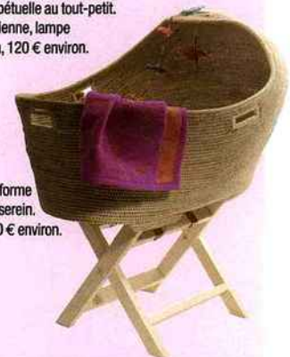
L'osier tressé autorise une forme ronde où bébé se sent serein. Zoepritz, berceau Lullaby, 590 € environ.