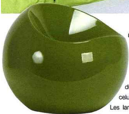
Ce fauteuil garantit une surprise à qui pénètre dans l'univers de bébé. File Dans Ta Chambre, chaise Ball, 150 € environ.

du monde des pirates, de celui des fées... Les lampes et les stickers complètent cette tendance ronde et apportent ainsi une touche pop sympathique. Souvenir de l'exubérance des années 1970, clin d'œil aux designs délurés de l'époque ou simple goût personnel pour ces créations originales... il ne faut pas s'en priver afin de