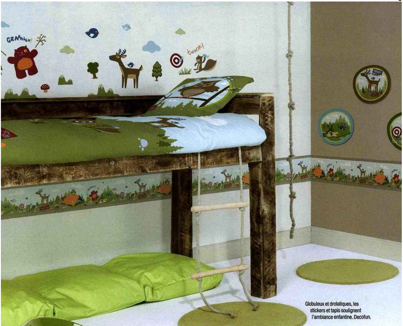
Globuleux et drolatiques, les stickers et tapis soulignent l'ambiance enfantine. Decofun.