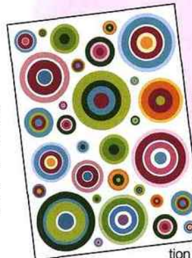
Tendance pop et patchwork de couleurs et voilà les murs qui pétillent ! Fnac Éveil & Jeux, décors Pop, 20 € environ.

rondeur ne fait aucune distinction rendant les princes et princesses parfaitement égaux. Du bleu ou du rose façon layette, du prune, du vert anisé... tout y est pour que chaque maman puisse réaliser son shopping sans peur de se trouver en manque d'objets nés de cette rondeur joviale.