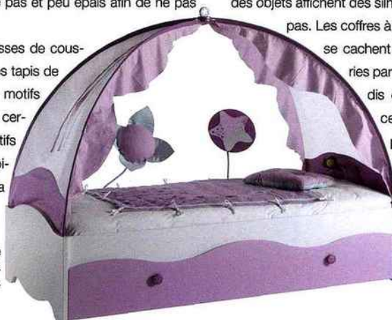
Le baldaquin de ce lit lui offre un dôme original qui étonne les princesses. Gautier, lit Fée, 890 € environ.

Les tours de lit, rideaux, housses de coussin, abat-jour en tissu, voire les tapis de change, se parent de mille motifs galvanisés par une rotondité certaine. Si des thèmes décoratifs offrent un avantage aux damoiseaux ou damoiselles, la