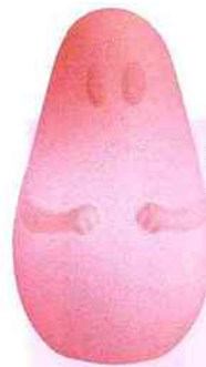
La lampe Barbapapa assure une jovialité perpétuelle au tout-petit. Leblon-Delienna, lampe Barbapapa, 120 € environ.