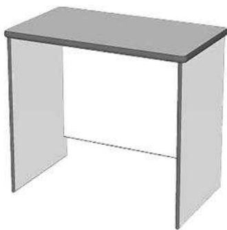
Réf. DAV BUREAU 99 BAS