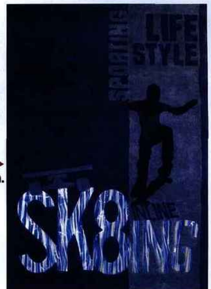
TENDANCE Tapis Sk8ter Boy, ▶ Unamourdetapis.com .