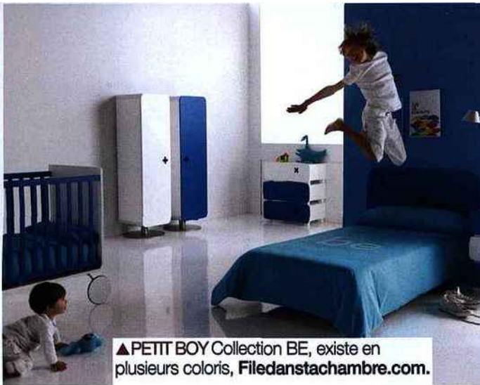
▲ PETIT BOY Collection BE, existe en plusieurs coloris, Filedanstachambre.com .