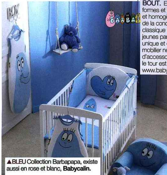
▲ BLEU Collection Barbapapa, existe aussi en rose et blanc, Babycalin.