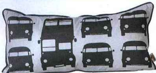
▲ VROUM VROUM Coussin Rush Hour, Ferm Living / Goodobject.com .