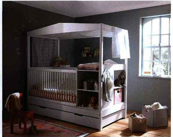
▲ TOUT EN UN Un concept ingénieux de mobilier qui accompagne l'enfant pendant plusieurs années. Combiné bébé et chambre junior, table à langer et meubles de rangement, Vertbaudet.