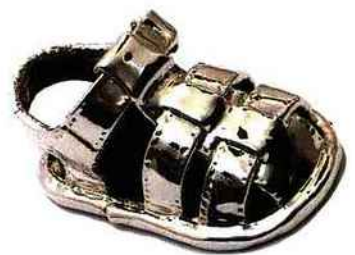
▲ ORIGINAL Chaussure d'enfant d'origine recouverte de métal argenté pour un élément de décoration à la fois design et personnalisé, Desmervilles.com.