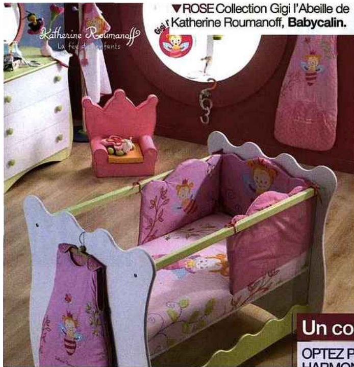
▼ ROSE Collection Gigi l'Abeille de Katherine Roumanoff, Babycalin.