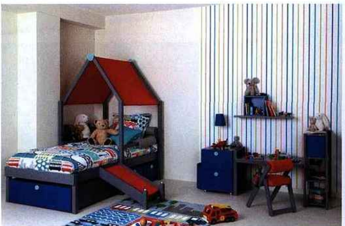
▲ DECOLLAGE Collection Embarquement Immédiat, Vibel .