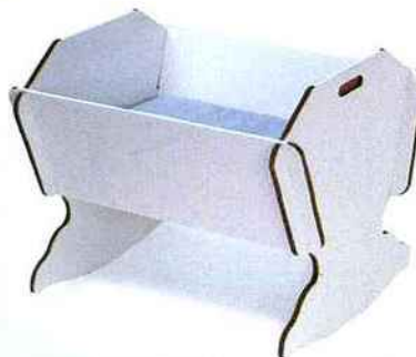
▲ ECOLOGIQUE Berceau en carton combinant modernité et esprit d'antan, économique, léger et résistant, Kraft-Decoline.com.