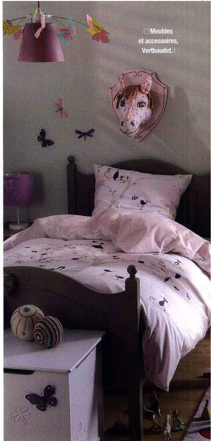
☐ Meubles et accessoires, Verthaudet. I

ces frises peuvent aisément disparaître pour faire face à une autre décoration en adéquation avec l'âge de votre bambin. Un autre moyen excellent de décorer sans contrainte est de jouer avec des stickers. Ils se posent et se retirent facilement, ne coûtent que quelques dizaines d'euros et peuvent donc évoluer avec votre enfant. Ce dernier sera ravi de passer quelques années avec eux avant de les remplacer par des posters de stars ou de belles autres trouvailles de son choix!