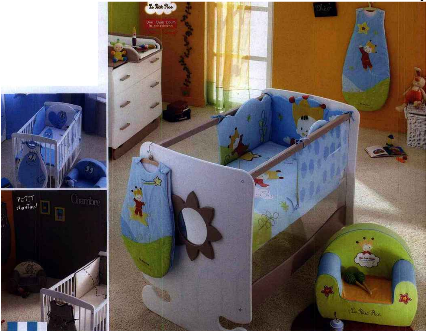
□ Accessoires. Indispensables pour finir la déco de la chambre. Porée Havlik |