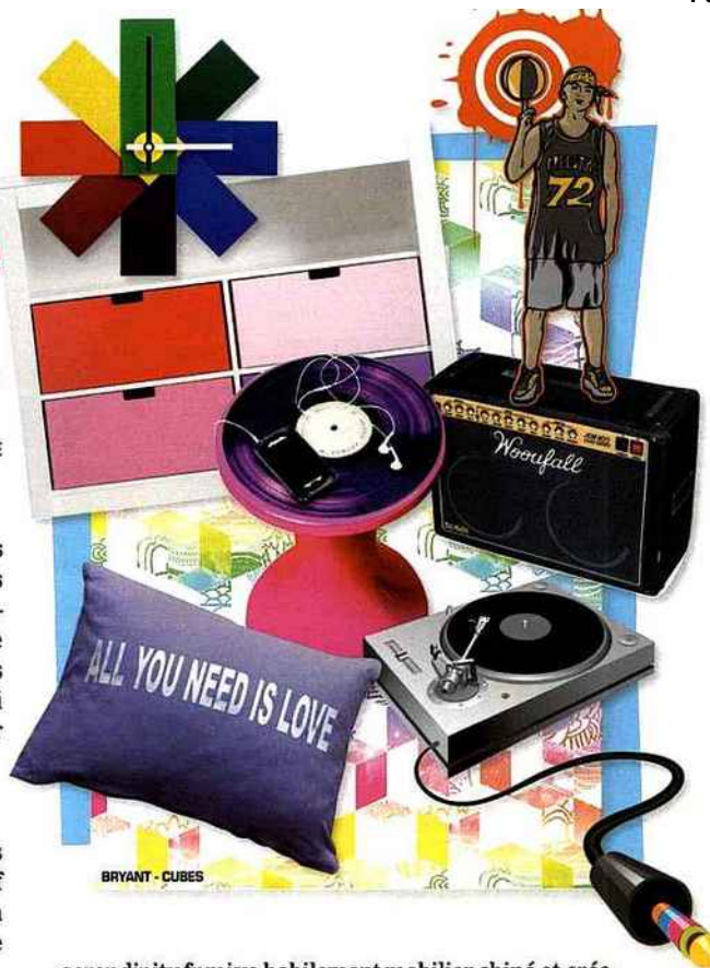
BRYANT - CUBES

Retrouvez un choix pointu de designers et d'éditeurs (Starck, Eames, Kartell...) chez balouga.com . Dans les petits prix, on opte pour l'horloge pop « Watch me » de Normann Copenhagen (40 €). Dans le même esprit,