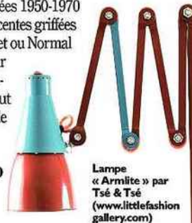
Lampe « Armilite » par Tsé & Tsé (www.littlefashion-gallery.com)