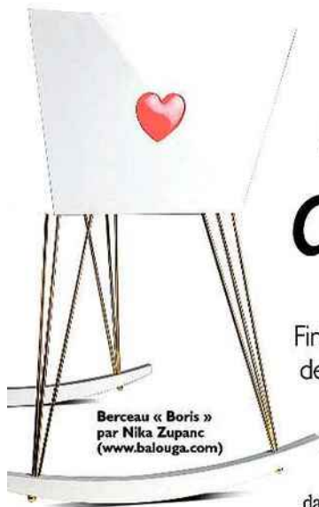
Berceau « Boris » par Nika Zupanc (www.balouga.com)