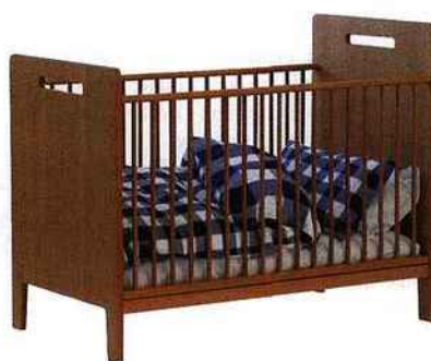
Signés HÅSTENS, lit bébé en chêne, 60 x 120 cm et lit junior en bouleau avec deux tiroirs, 90 x 200 cm. 860 € et 1 160 €. La célèbre marque de literie de luxe suédoise fabrique depuis 1852 des lits 100 % naturels, composés de crin de cheval, de laine, de lin et de coton. En vente sur filedanstachambre.com .

Les meubles doivent être à la hauteur de l'enfant pour favoriser son autonomie et éviter qu'il n'essaie de grimper sur une chaise ou un tabouret au risque de tomber. Il doit pouvoir aller, venir, dessiner, s'asseoir et descendre de son lit seul.