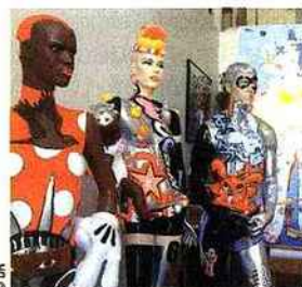
Des mannequins de vitrine vêtues de glycéro et d'acrylique.