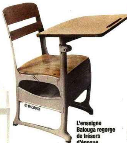
L'enseigne Balouga regorge de trésors d'époque.

Des créations miniatures au mobilier évolutif, en passant par le vintage, la chambre d'enfant est le nouveau terrain de jeu des designers.